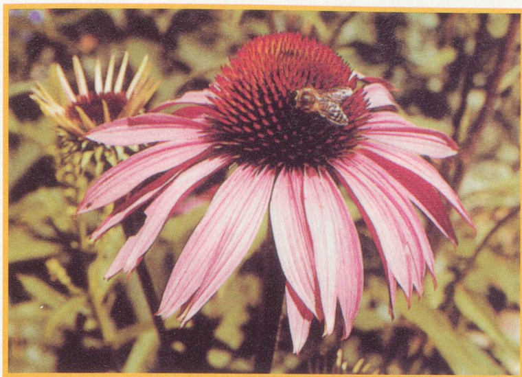
L'échinacée était utilisée par les Indiens d'Amérique

seule Chine comme maintenant. Incroyablement résistant, il a même survécu à la bombe larguée sur Hiroshima. Le printemps suivant, une pousse reprenait sur la souche d'un ginkgo calciné.