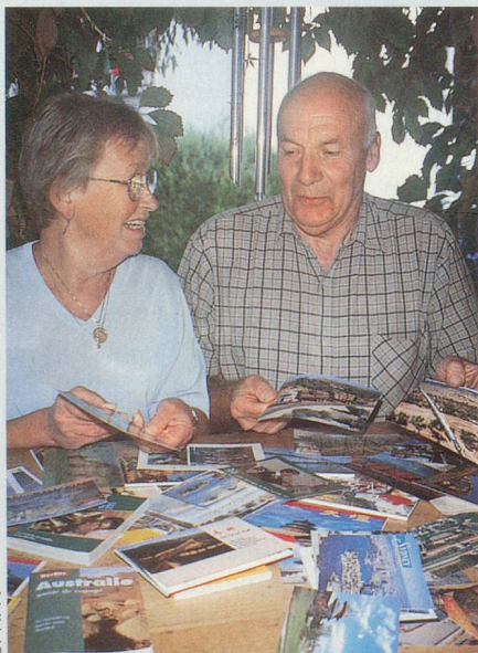
Lili avoue un certain penchant pour ces messieurs en uniforme