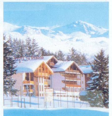
Hôtel La Prairie, à Montana.

dès le 4.01.03, Fr. 85.- par jour en 1/2 pension. Pension complète + Fr. 25.- par repas. Chambre individuelle en saison + Fr. 20.-. Repas valaisan sur demande, servi dans notre carnotzet «Le Chaudron». Situation tranquille, à proximité des pistes de ski de fond. Terrasse, ambiance familiale, cuisine soignée. Service de minibus privé. Pour vos réservations. Tél. 027 485 41 41 - fax 027 485 41 42.