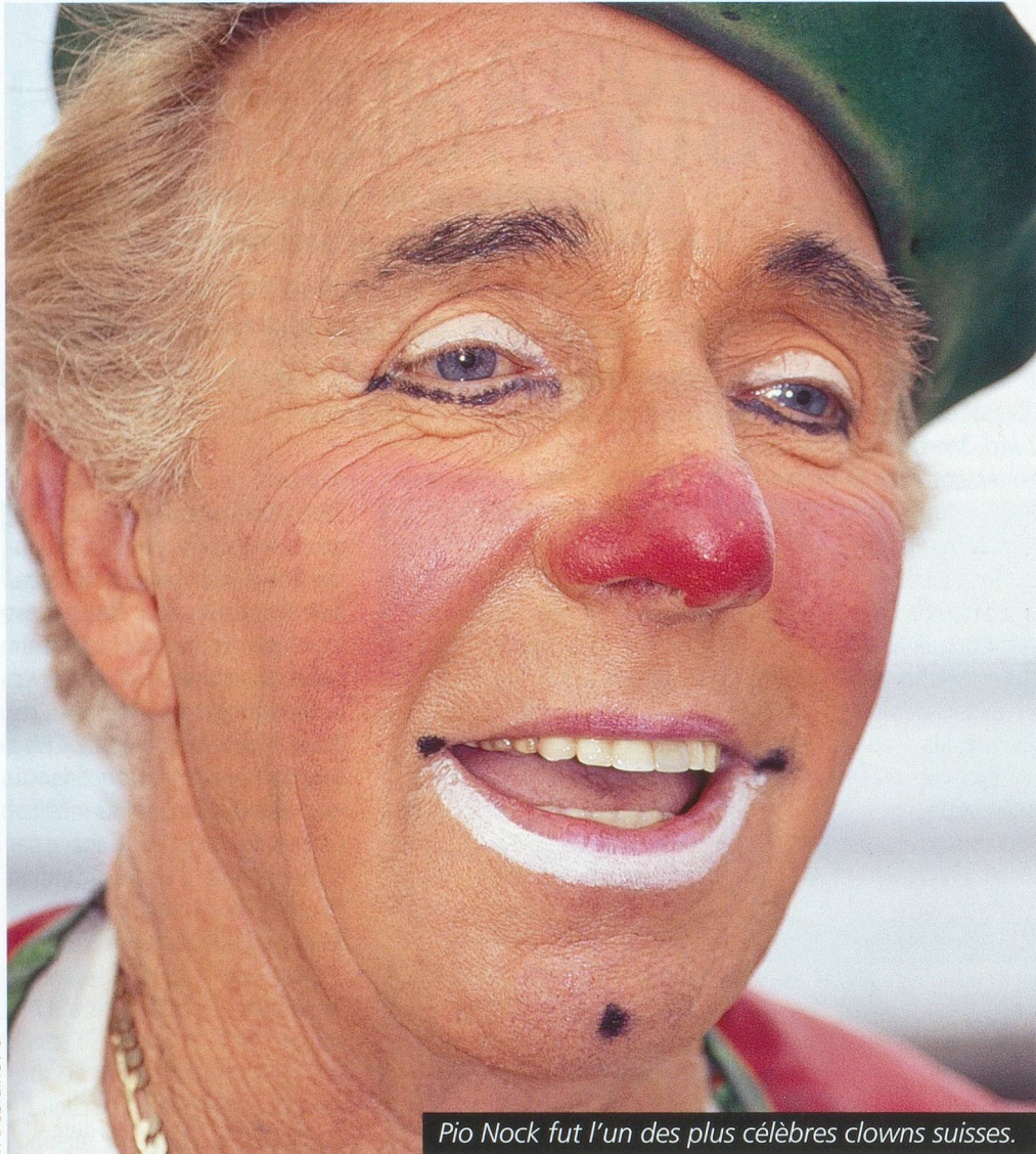
Pio Nock fut l'un des plus célèbres clowns suisses.