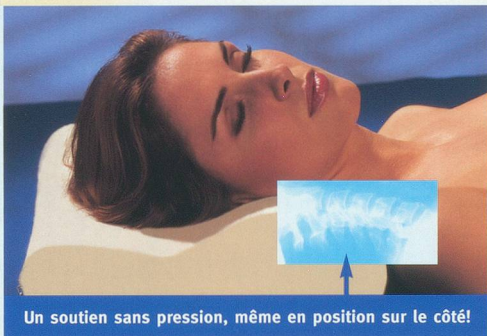
Un soutien sans pression, même en position sur le côté!

Un soutien optimal de votre colonne vertébrale se traduit par un sommeil sain, sans courbatures.