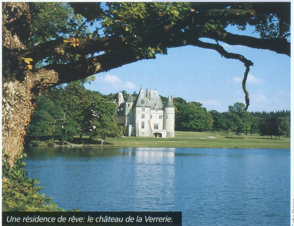
Une résidence de rêve: le château de la Verrerie.

Ain: Alain Chapel à Mionnay, tél. 0033/478 91 82 37. Route Jacques-Cœur: Abbaye de Saint-Ambroix, à Bourges, tél. 0033/248 70 70 00. Côme et environs: Giardino di Cillis Cristino, tél. 0039/031 51 11 54. Vorarlberg: le Caruso à Dornbirn, tél. 0043/5572 23379.