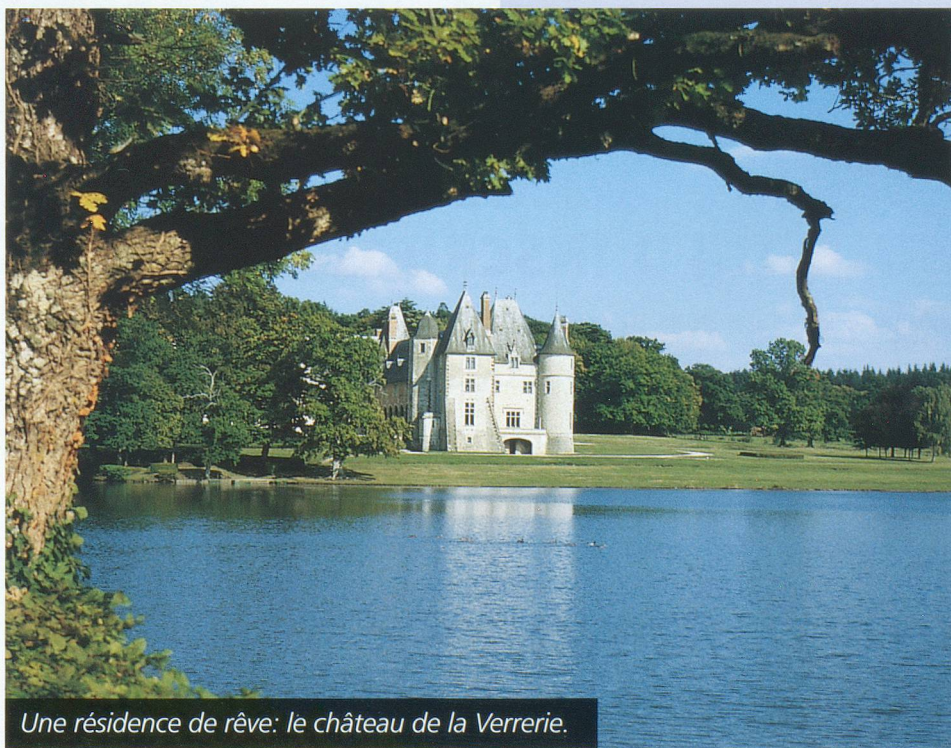
Une résidence de rêve: le château de la Verrerie.

Vorarlberg: le Caruso à Dornbirn, tél. 0043/5572 23379.