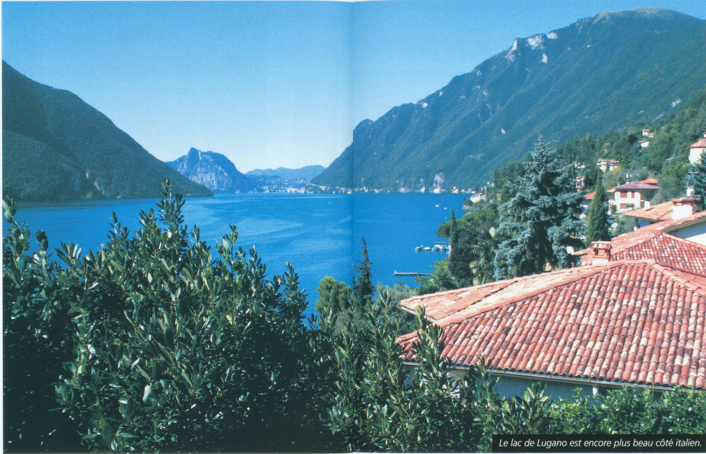
Le lac de Lugano est encore plus beau côté italien.

■ Il faut parfois savoir changer radicalement dans ses habitudes de conducteur et échapper aux grands axes autoroutiers. Il faut alors prendre le temps d'admirer les paysages, de se trouver une bonne petite auberge qui vous servira des spécialités locales, de visiter des sites hors des heures d'affluence... Voici quatre suggestions de lieux souvent ignorés.