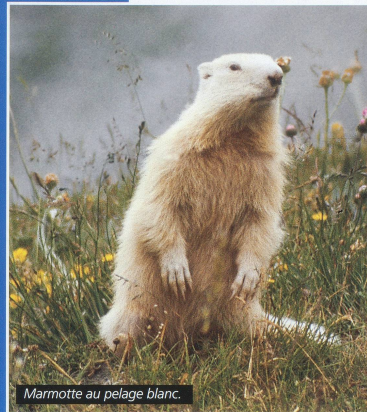
Marmotte au pelage blanc.