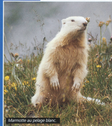
Marmotte au pelage blanc.