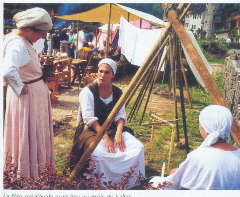
La fête médiévale aura lieu au mois de juillet.

Fête médiévale, 11-13 juillet 2003: entrée Fr. 15.- par jour. Case postale, 2882 St-Ursanne, tél. 078 845 24 77. Internet: www.medievaux.ch.