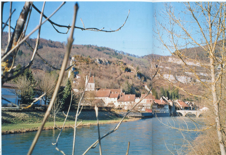
Joyau du Clos du Doubs, la petite cité médiévale de Saint-Ursanne.

au détour du chemin. La rivière coule lentement entre deux berges tranquilles. Sur la droite, une pisciculture rappelle aux gourmets que la truite est l'emblème gastronomique de la région. Mais des truites, il n'y en a plus guère dans le lit du Doubs. «Juste assez pour les pêcheurs», aime à relever les jaloux.