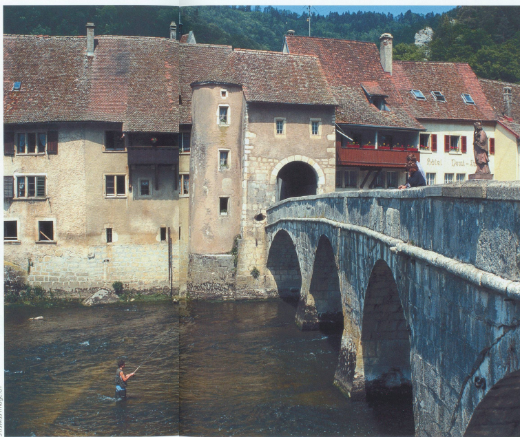
Pour entrer à Saint-Ursanne, il suffit de franchir le pont de pierre.

Aujourd'hui encore il reste des vestiges de l'ermitage au nord de la collégiale. On y accède par un escalier qui mène à la grotte où aurait vécu saint Ursanne. Un monument représente d'ailleurs le saint en méditation, sous l'œil intéressé d'un ours taillé dans le roc, son fidèle compagnon. La restauration (discutable du point de vue artistique) a été terminée en 1999.