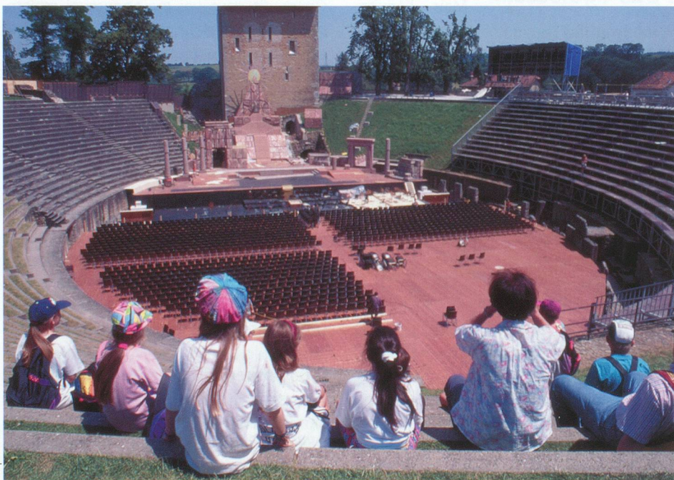
L'amphithéâtre d'Avenches accueille encore des spectateurs, 2000 ans plus tard.

L'installation d'une légion romaine en garnison à Vindonissa (Windisch) s'inscrit dans l'occupation progressive des lieux de passage stratégiques. On est alors en 14 après J.-C., et l'empereur Tibère vient de renoncer à