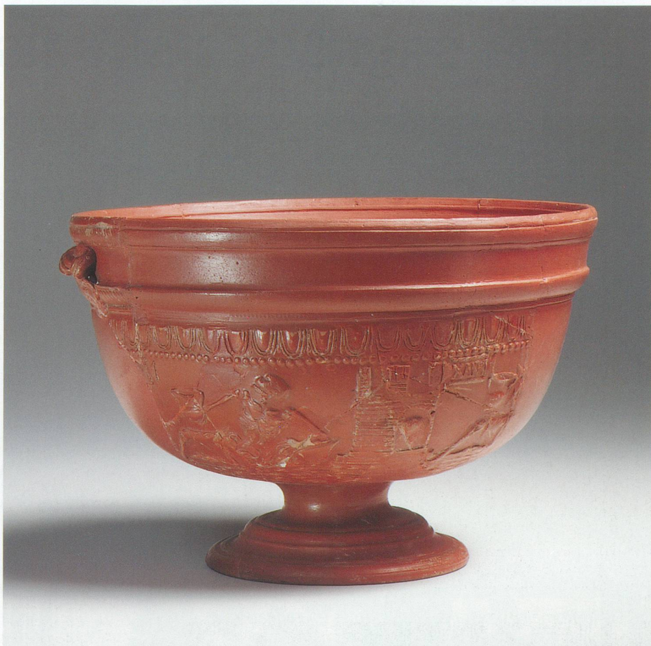
Les Romains ont importé leur vaisselle de luxe: la sigillée.

Le MDA vaudois organise chaque année des visites guidées sur des sites romains, en collaboration avec le Musée romain de Lausanne-Vidy; renseignements au 021 321 77 66.