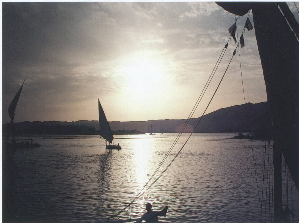
Au soleil couchant, les felouques rentrent au port.