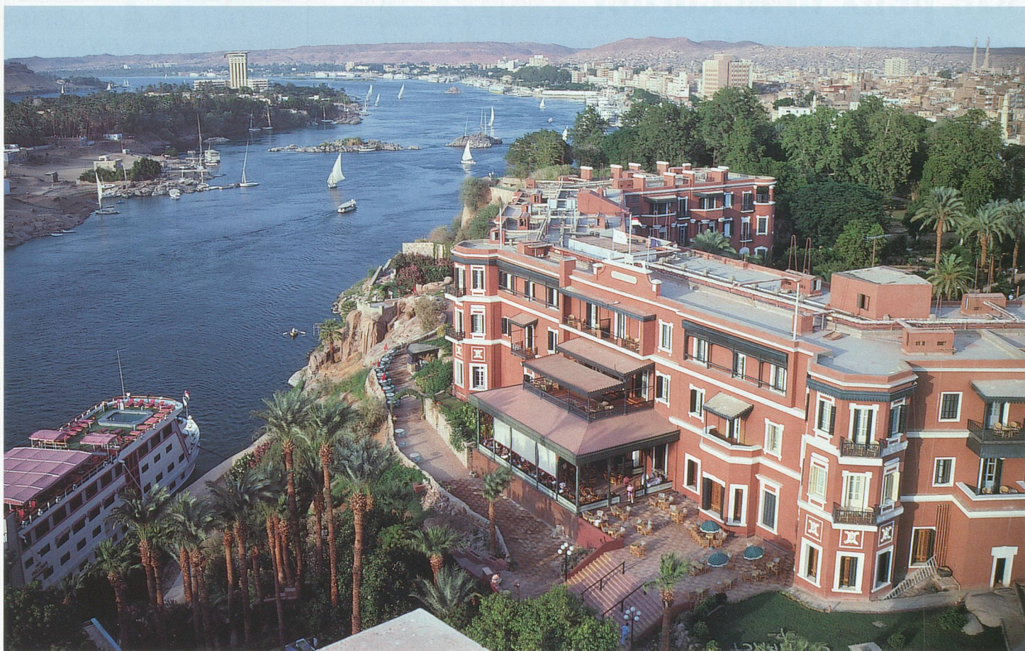
L'hôtel Old Cataract, où Agatha Christie résida pour écrire son célèbre roman à suspense Mort sur le Nil .