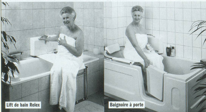
Lift de bain Relex