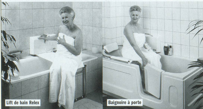
Lift de bain Relex