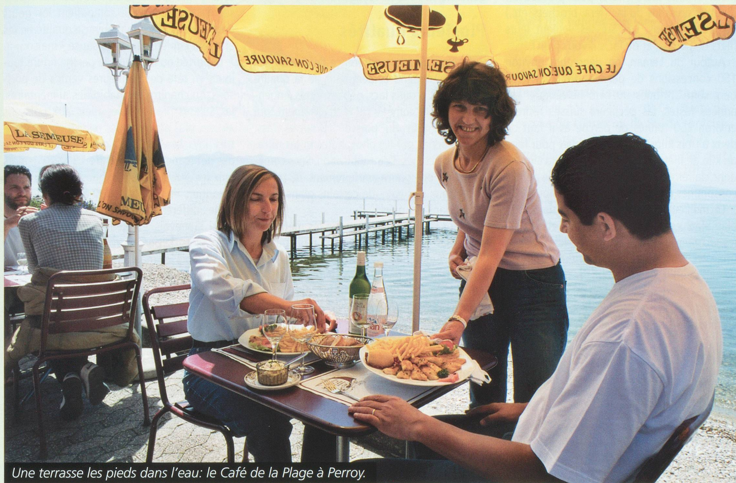
Une terrasse les pieds dans l'eau: le Café de la Plage à Perroy.