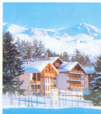
Hôtel La Prairie, à Montana

Côte d'Azur - Cap Soleil , 3 pièces/6 personnes, loggia, lave-linge, lave-vaisselle, téléphone, télévision, coffre-fort, vue + accès mer, piscine, tennis, site exceptionnel, dès Fr. 395.-. Tél. 022 792 79 92.