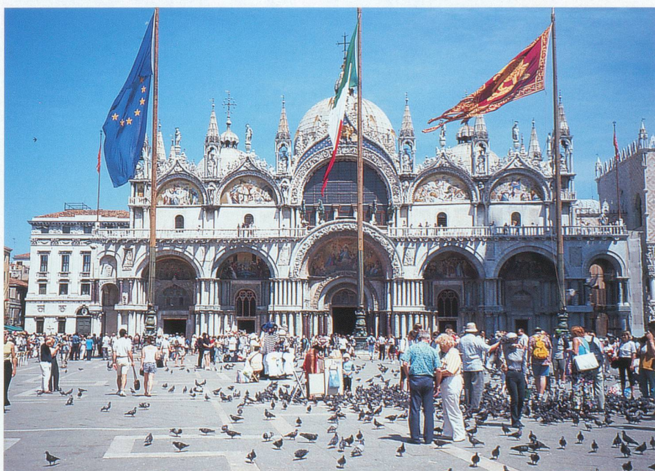
De nombreux pigeons hantent la place Saint-Marc.

Les rues de Venise ont pour agréable particularité d'être piétonnières, les transports urbains étant essentiellement assurés par des bateaux de tous calibres, qui font ronfler leurs moteurs, fort heureusement dans la lagune ou sur le grand Canal. Les légendaires gondoles sont des éléments certes décoratifs, mais, après tout, bien agréables pour qui veut flâner en paresseux. La meilleure manière de visiter Venise reste celle de parcourir à pied le dédale des ruelles et de découvrir de véritables tableaux artistiques comme, par exemple, ici une petite place arborisée, là un atelier de peinture sur poterie, là encore un ponton avec une enfilade de gondoles, etc.