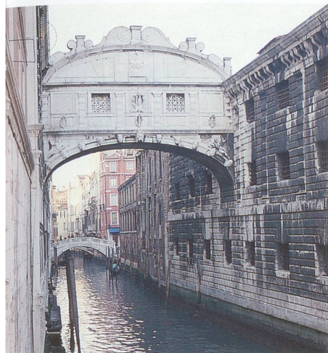
Le célèbre pont des Soupirs.

les plus belles toiles des prestigieux artistes que sont Titien, le Tintoret, Tiepolo, Carpaccio et Véronèse. Les autres sites où l'on peut aussi admirer les grandes toiles vénitienes sont, par exemple, la Scuola Grande di San Rocco, la Scuola San Giorgio degli Schiavoni et l'ancienne église paroissiale du Tintoret qui porte le nom de Madonna Dell'Orto.