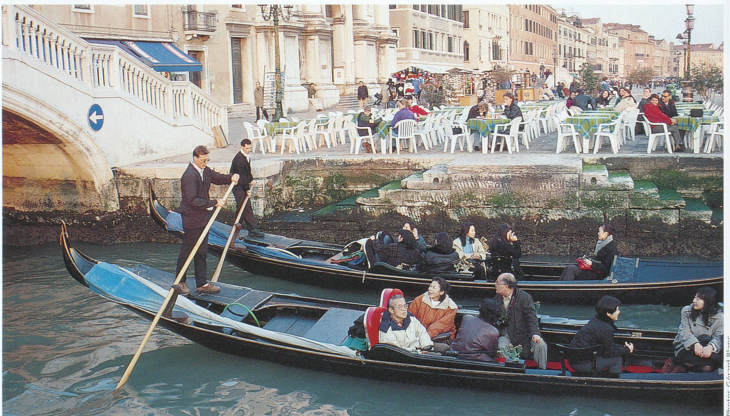
Une balade à bord des légendaires gondoles demeure très romantique.

L'Académie est le second must de Venise; c'est ici que se trouvent réunies, entre autres,