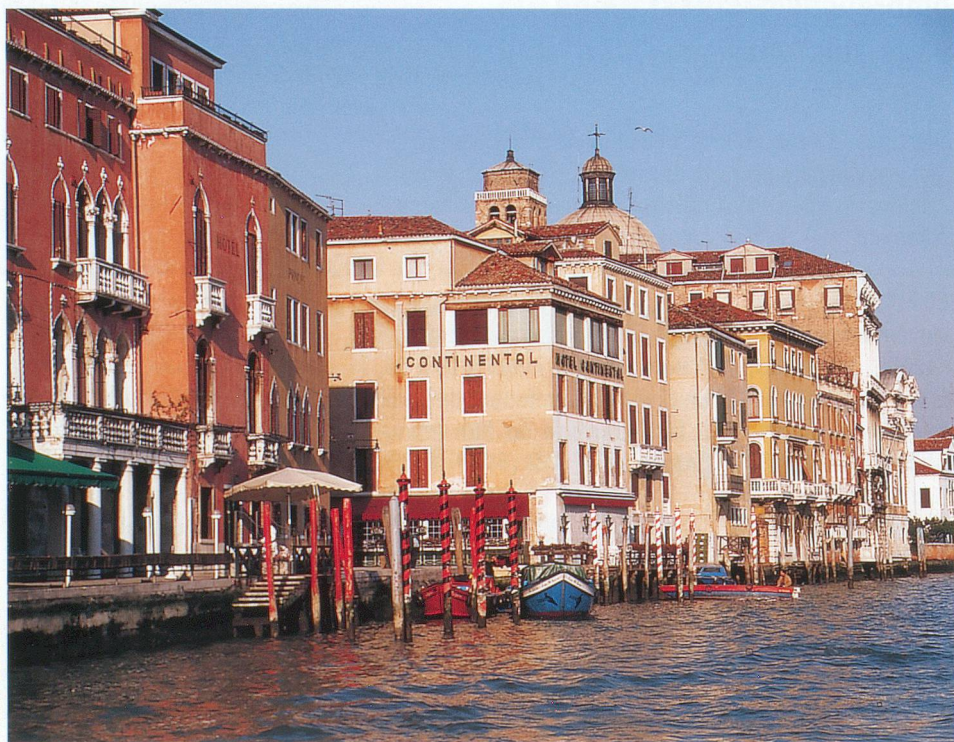
Les palais vénitiens que l'on admire en longeant le Grand Canal.

Dès lors, la domination expansionniste de Venise ne cessa de croître avec les intégrations terrestres de la côte dalmate, de Gênes,