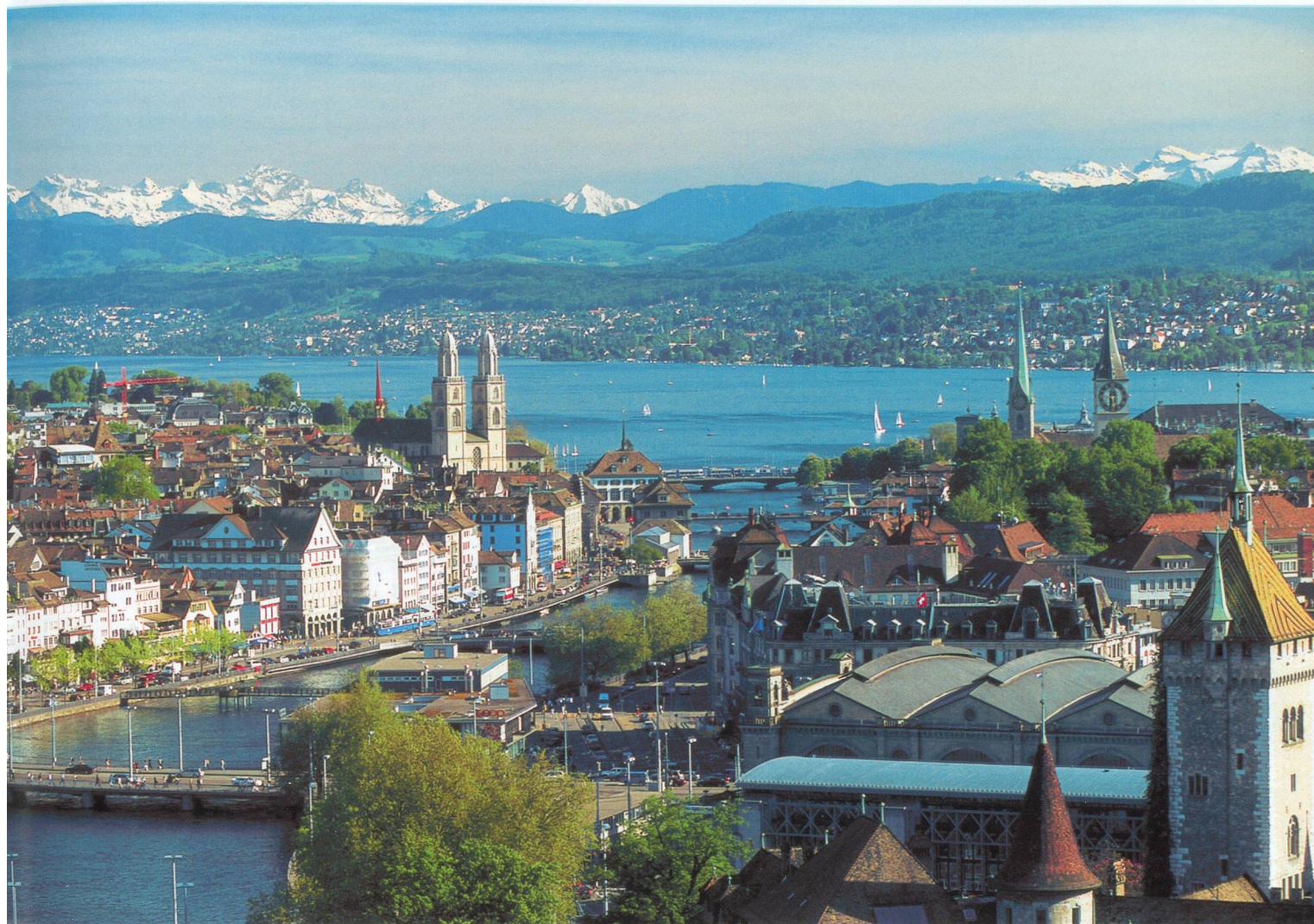
Vue de la ville de Zurich avec au premier plan les quais de la Limmat.

Theater Spektakel , qui dure trois semaines, fin août-début septembre. On y découvre une incroyable variété de spectacles en différentes langues, sous des tentes et à ciel ouvert. Sans oublier de nombreux petits théâtres d'essai.