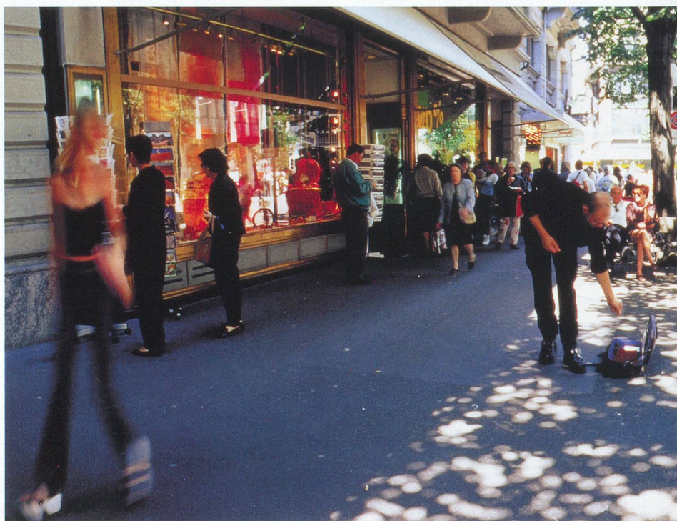
Les boutiques de luxe se côtoient sur la célèbre Bahnhofstrasse.

A Zurich, l'embarras du choix des spectacles est total. Qu'on en juge: le Schauspielhaus, le Schiffbau, les Zürcher Festspiele, qui marquent pendant quelques semaines (en juin et juillet) la fin de la saison. Ajoutez la Street Parade, qui a lieu en été et le Zürcher