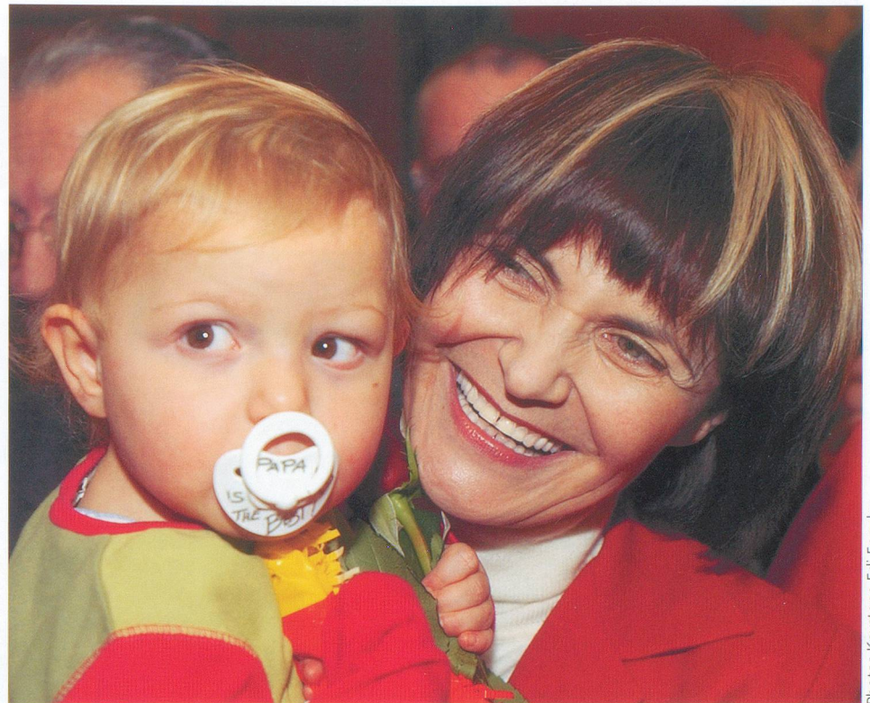
Une grand-maman attentionnée comme toutes les autres.

– La langue utilisée pour le travail et le lieu où j’habite. Je travaille à Berne et j’ai une