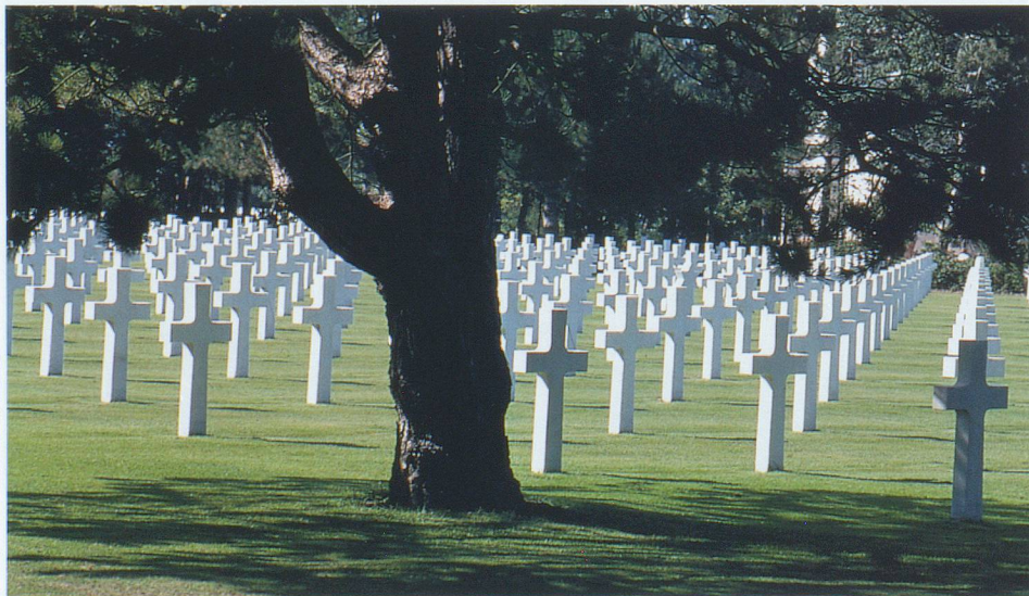
Les impressionnantes alignées de croix du cimetière américain de Colleville.