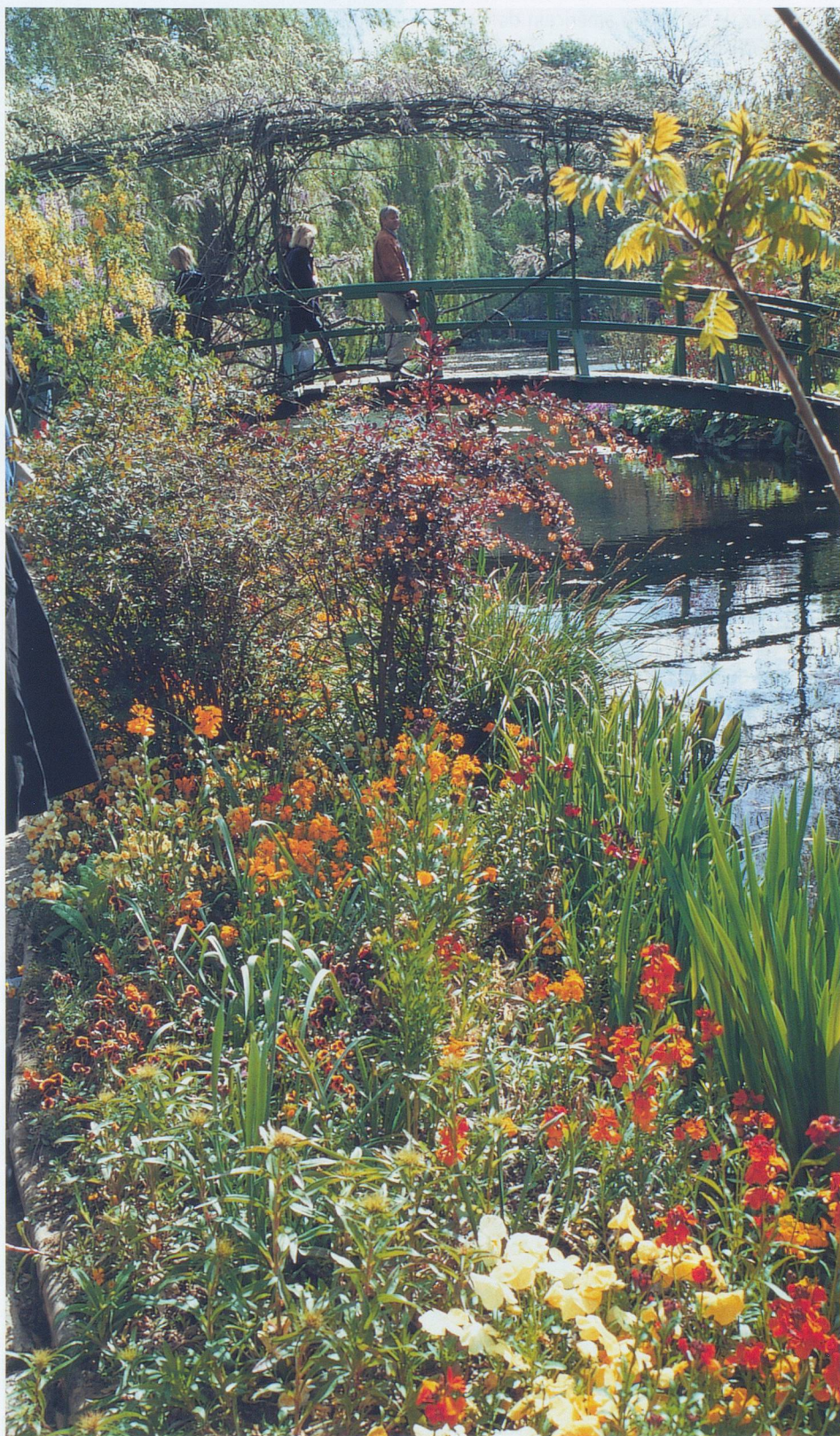
Le célèbre étang aux nymphéas de Monet à Giverny.

Le Débarquement débuta dans la nuit du 5 au 6 juin, par un bombardement intense des positions allemandes. Trois divisions de parachutistes prirent ensuite position à Sainte-Mère-Eglise (Américains) et à Ranville