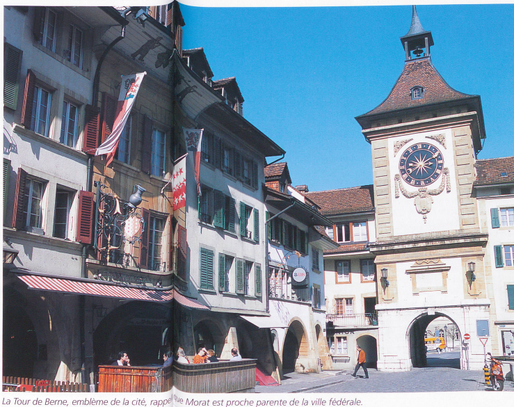
La Tour de Berne, emblème de la cité, rappelle que Morat est proche parente de la ville fédérale.

parts et à un point de vue exceptionnel sur le site de la bataille. «Pendant longtemps, quand le lac se colorait d'une algue rouge, l'on disait: C'est le sang des Bourguignons », raconte Erhard Lehmann. Aujourd'hui, avec les progrès de la protection de l'environnement et l'épuration systématique des eaux, le lac ne se teinte plus, mais le souvenir de cette guerre reste vivant. Chaque année, les écoliers et les jeunes commémorent le 22 juin par un cortège: la Solennité. Un tir historique