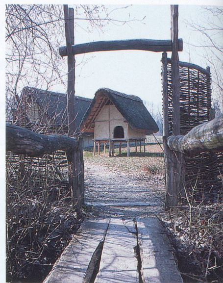
Reconstitution d'un village du néolithique à Gletterens.

Un sentier pédestre relie Morat à Sugiez, de l'autre côté du lac, par la forêt du Chablais. L'ascension du Vully, petite colline qui culmine à 653 mètres, n'est pas très difficile. Depuis les villages de Praz ou Môtier, on atteint le sommet en moins d'une heure. Mais