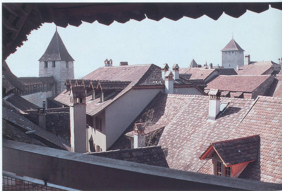
Tuiles et cheminées vues des remparts.