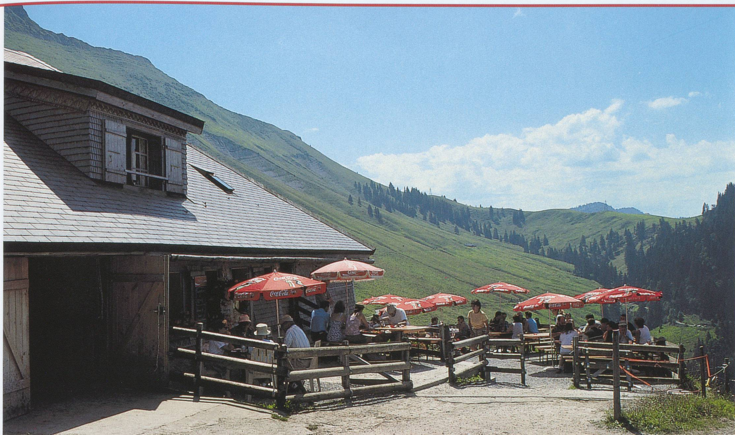
Depuis 20 ans, Raoul Colliard accueille les randonneurs dans son chalet d'alpage de la Saletta.