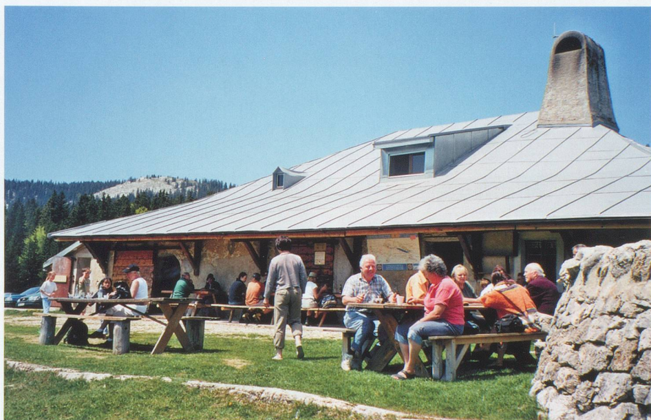
Le chalet des Pralets est situé entre La Givrine et le Marchairuz.