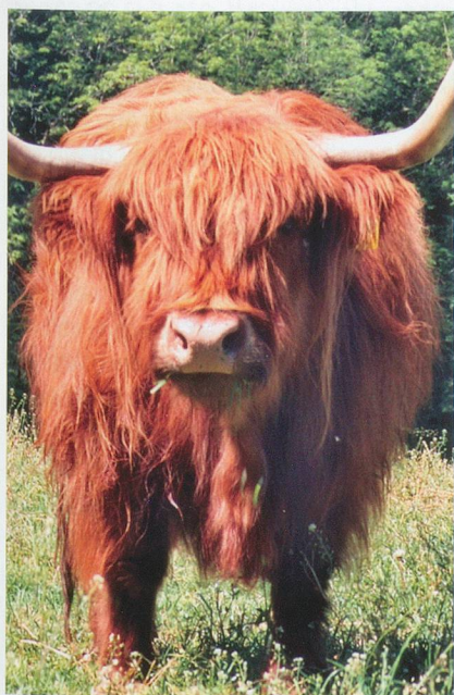
Une centaine de vaches écossaises paissent aux alentours des Pralets.