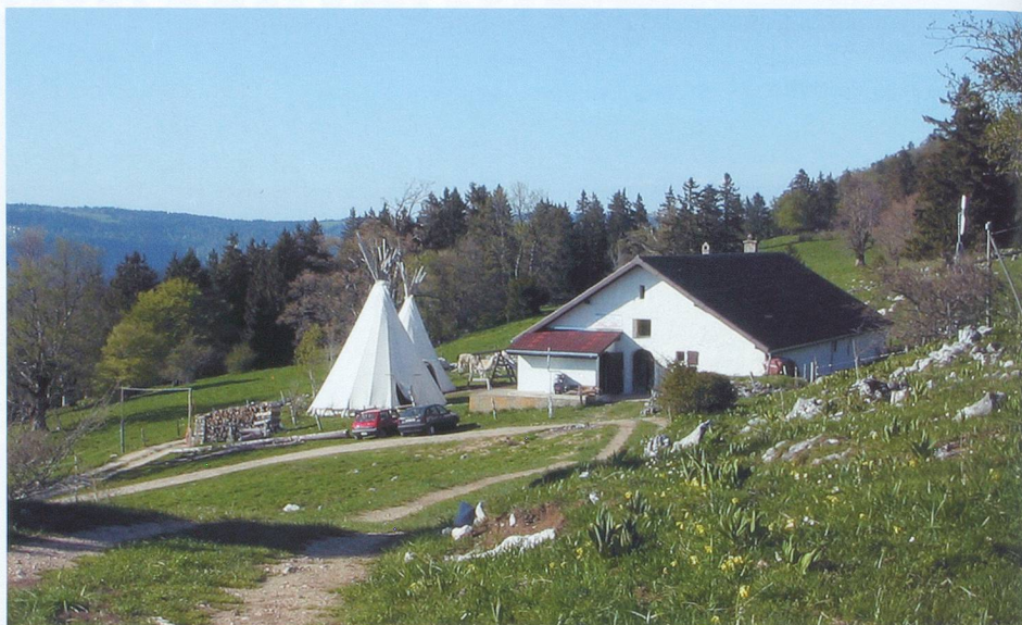
Depuis la métairie d'Aarberg on jouit d'une vue imprenable sur le lac de Neuchâtel.

La métairie d'Aarberg est située dans un cadre idyllique, réputé pour ses couchers de soleil sur les crêtes jurassiennes. Une vue à 360° permet d'admirer d'un côté le lac de Neuchâtel et de l'autre, les éoliennes du Mont-Soleil. Depuis le village de Villiers (Val-de-Ruz), on suit la direction Clémesin, puis les panneaux Aarberg (dernier tronçon non goudronné). Le lieu offre une touche insolite avec ses deux tipis rescapés d'Expo.02, autour desquels broute un troupeau de lamas. Construite par la bourgeoisie d'Aarberg, la métairie, qui garde en estivage une septantaine de génisses, est l'une des plus anciennes du canton de Neuchâtel. Elle date de 1551 et les