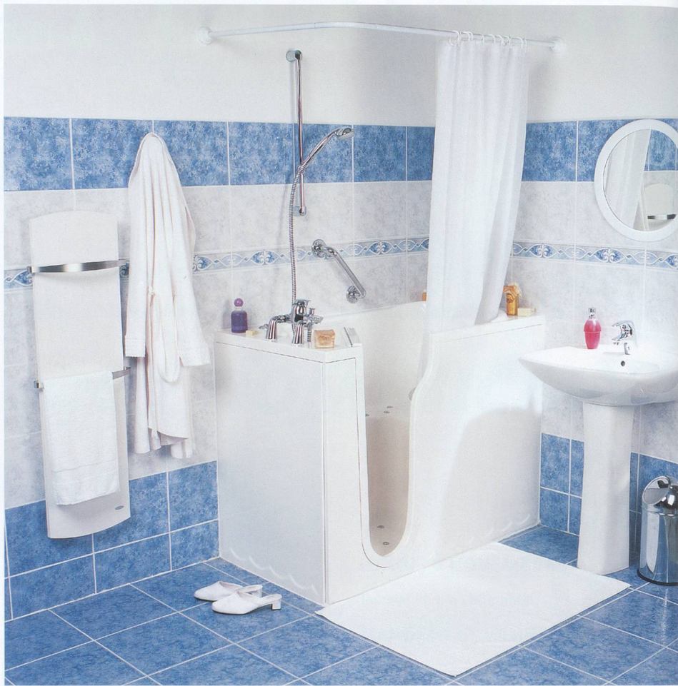
Ce système de porte facilite l'accès à la baignoire.

Les zones de bains ou de douches sont particulièrement glissantes, elles aussi. Plusieurs moyens sont à disposition pour y remédier.