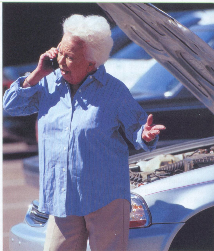
Dans les cas d'urgence, le portable se révèle très utile.

La première étape a consisté à éditer une petite brochure qui a pour mérite d'être imprimée en grands caractères et d'utiliser des termes ultra-simples (les brochu-