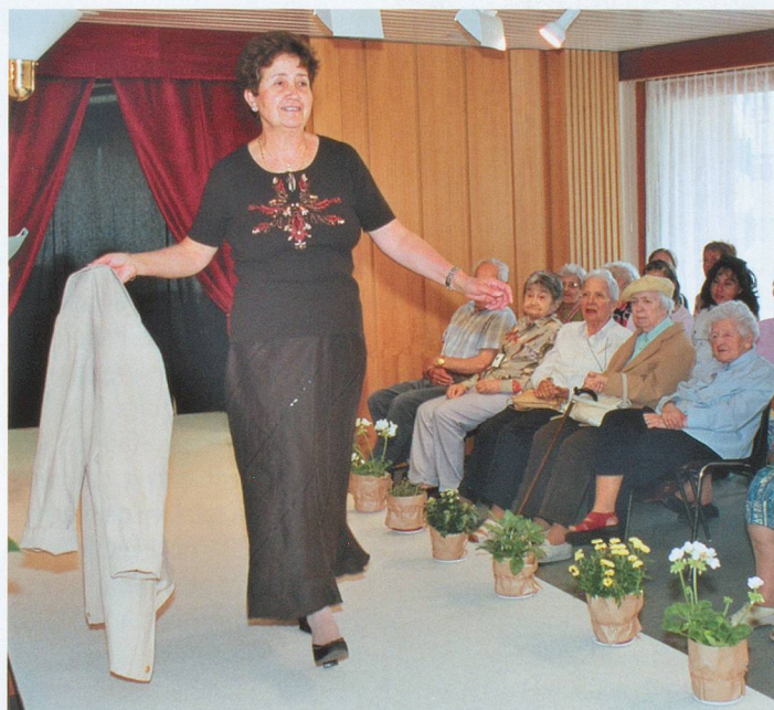
Longue jupe noire et petit pull à impressions colorées, un ensemble à porter en toute occasion.

»» Home médicalisé de Clos-Brochet, rue Clos-Brochet 48, 2000 Neuchâtel, tél. 032 722 71 00.