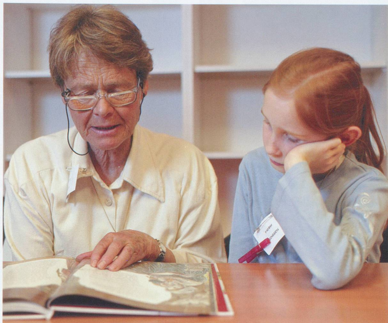
Lire et écouter une histoire: deux plaisirs partagés.