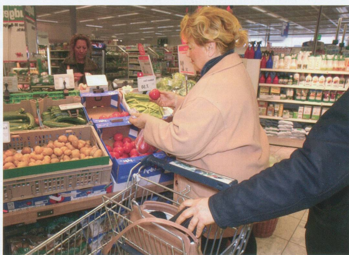
Prévention suisse de la criminalité, Neuchâtel