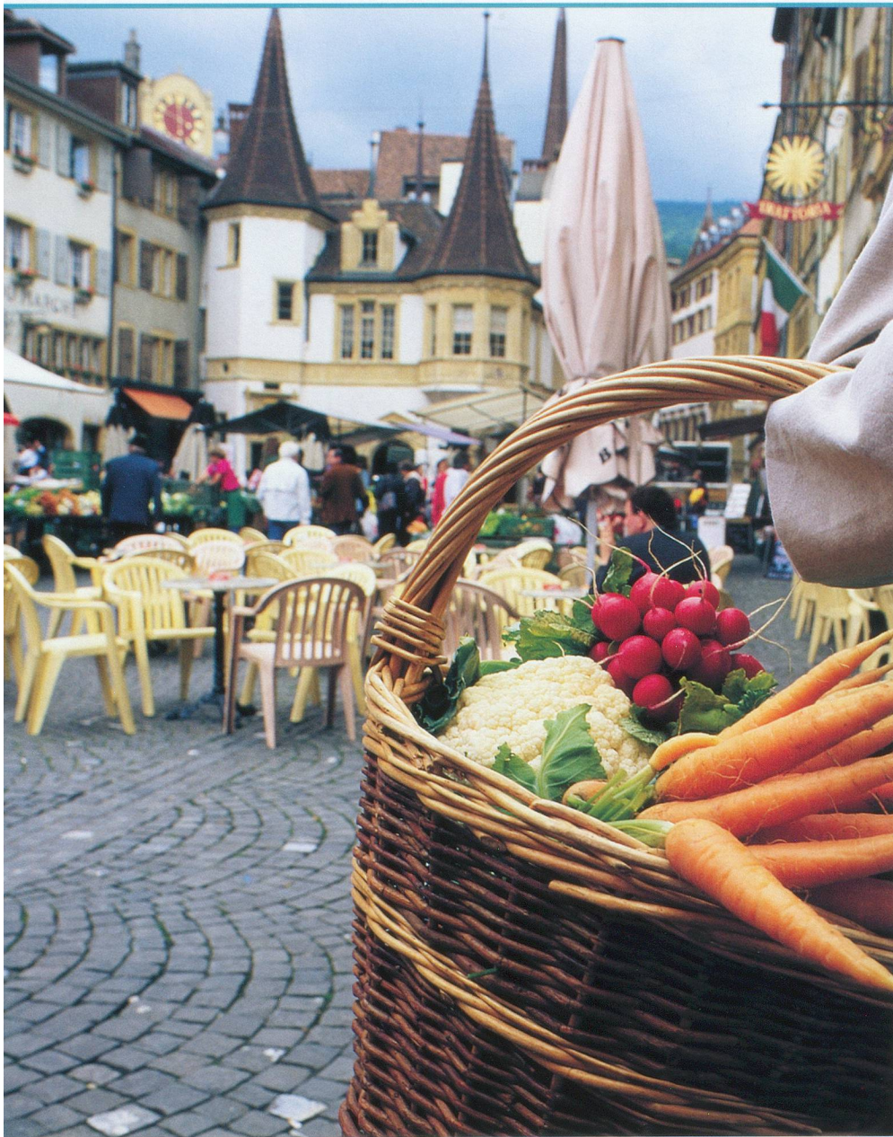
Place des Halles, chaque semaine s'y tient le marché.

guillotiné en 1941, sans que la Suisse n'intervienne. Il avait 25 ans et n'a été réhabilité que très récemment. Il a fallu en effet attendre plus de 60 ans pour que son geste héroïque soit reconnu comme tel et qu'une plaque vienne le rappeler.