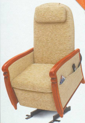
NOUVEAU Modèle: Louvre fauteuil releveur