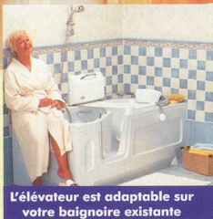
L'élévateur est adaptable sur votre baignoire existante

Pour votre sécurité et indépendance du bain: demandez notre brochure en couleurs gratuite!