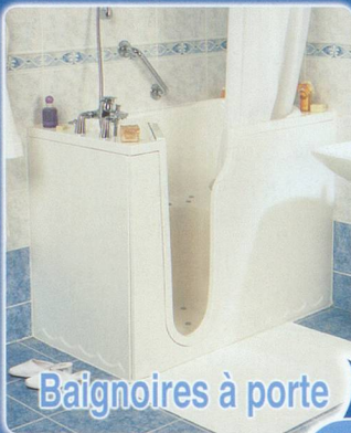
Baignoires à porte