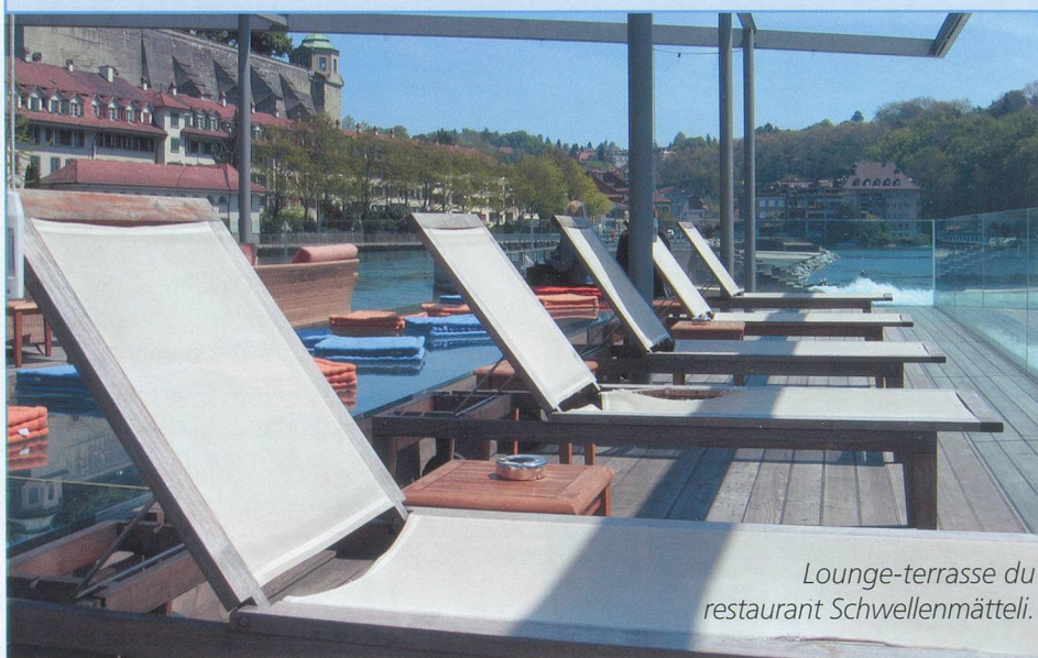
Lounge-terrasse du restaurant Schwellenmätteli.

Il suffit de passer le pont, celui du Kirchenfeld, et juste avant l'Helvetiaplatz, sur laquelle donne le château renfermant le Musée historique de Berne, on descend sur la gauche en direction du Schwellenmätteli. Un petit chemin, dans le bois, nous mène à ce restaurant bien connu des Bernois. En partie construit sur l'Aar, l'endroit refait à neuf, est conçu dans un style très contemporain. Sur la terrasse en teck, le bar se partage en lounge et coin-repos avec chaises longues. Pour un peu, on se croirait sur le pont d'un paquebot! Le bâtiment, entièrement vitré, permet de manger en toute saison sur la