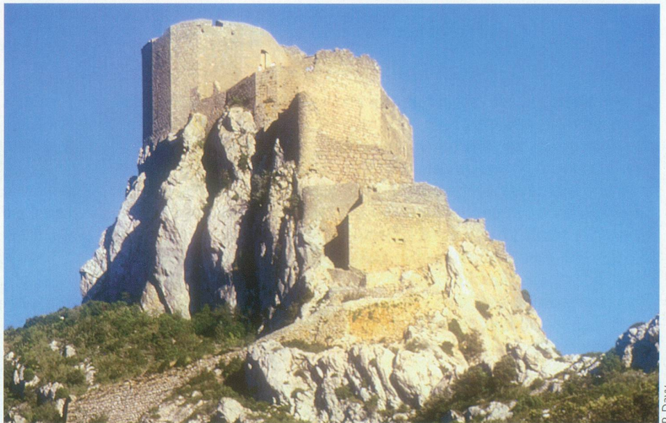
Quéribus se dresse entre ciel et terre.

De loin, les forteresses semblent un prolongement des rochers, tant elles s'intègrent dans leur environnement. Y accéder n'est pas si facile, même de nos jours! De bons sentiers mènent à Peyrepertuse et à Quéribus, deux des «citadelles du vertige» comme on les a si joliment rebaptisées. Il faut cependant s'arc-bouter pour mieux