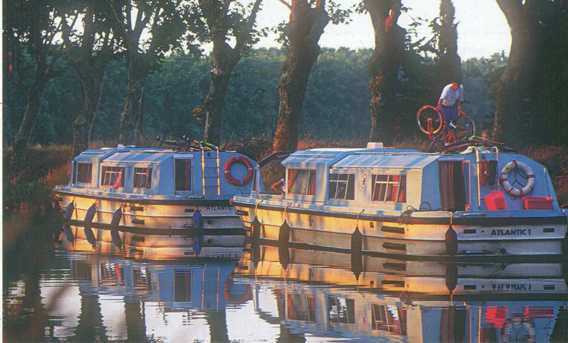
Le paisible Canal du Midi sert aujourd'hui à la navigation de plaisance.