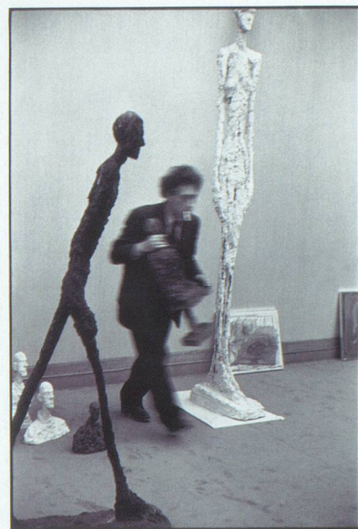
Alberto Giacometti vu par Henri Cartier-Bresson.

De nombreuses photographies témoignent subtilement de l'amitié entre les deux hommes. Ainsi, celle intitulée L'homme qui marche sous la pluie , c'est-à-dire Giacometti, en 1961 à Paris, marchant à la rencontre de son ami, sous une averse, un vieil imperméable