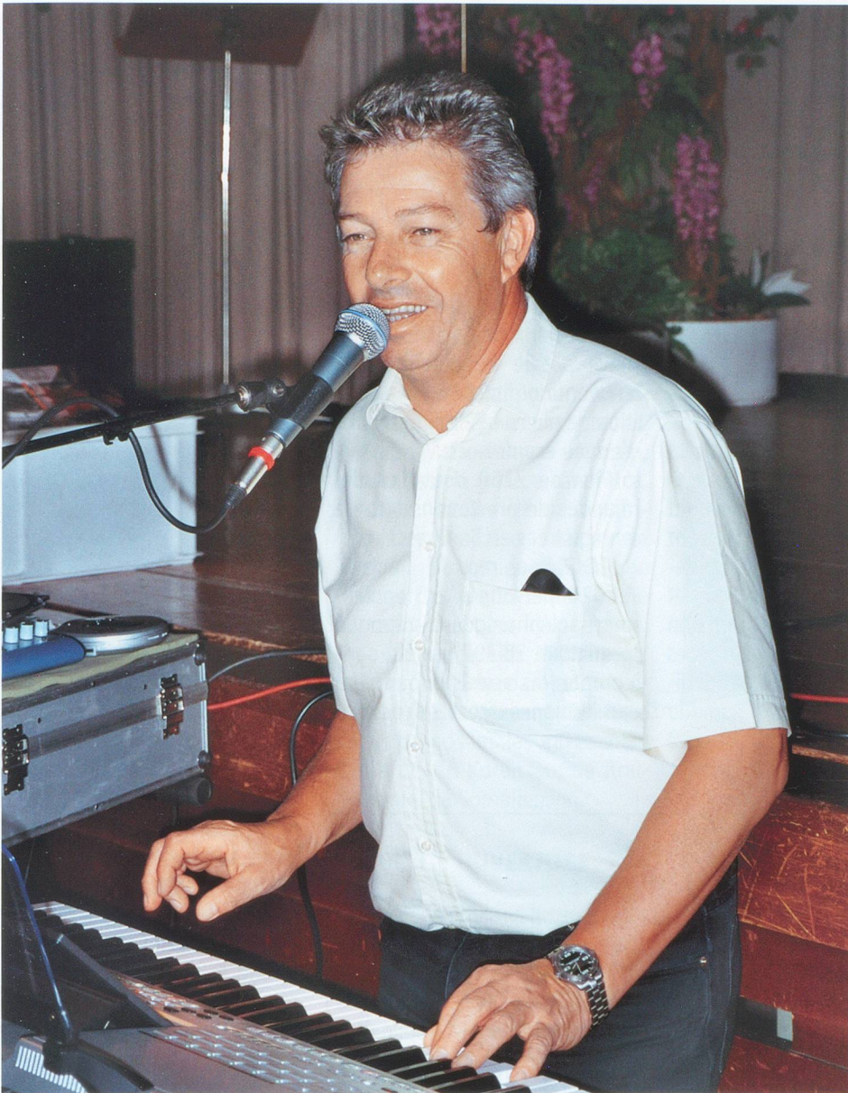
L'animateur des thés dansants connaît plus de 200 chansons.

concert, quelques admiratrices sont venues le saluer à leur manière, d'un petit bisou très chaste mais chaleureux.