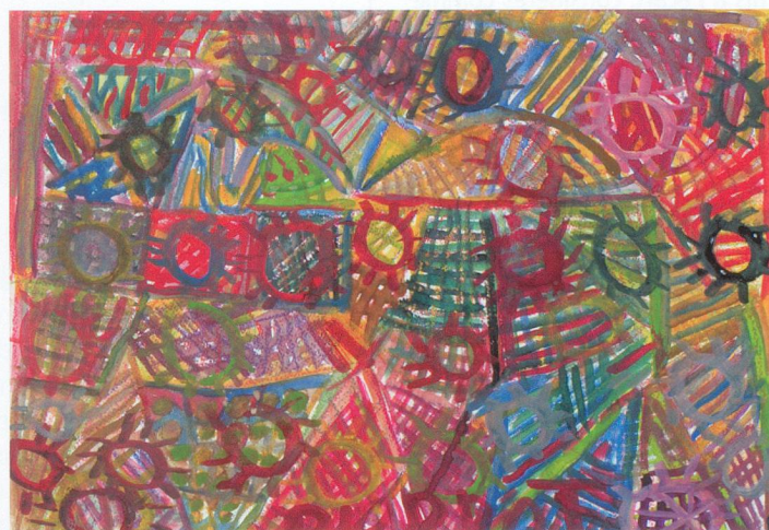
Pierrot Garbani, sans titre , s. d., gouache et pastel sur papier (24x32cm), Collection de l'Art Brut, Lausanne.