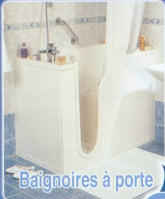
Baignoires à porte