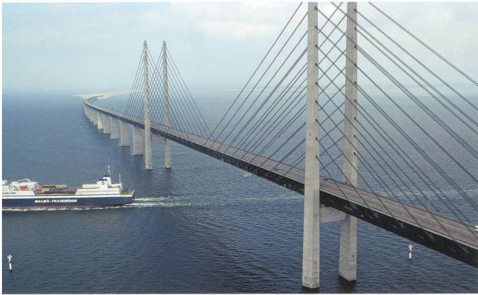
Le pont entre le Danemark et la Suède: impressionnant...

habitants de Scanie les accommodent de quantité de manières succulentes. Ils en font même des glaces, dont le résultat est tout à fait curieux et délicieux!