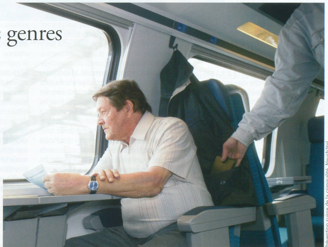
Prévention suisse de la criminalité, Neuchâtel

Conseil: les voleurs en veulent à votre argent. En conséquence, ne l'exhibez pas en public et soyez vigilants avec vos biens.