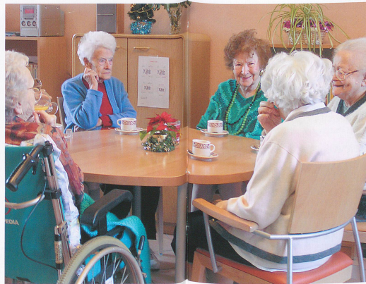
Les lieux de rencontres et d'échanges sont très importants dans les EMS.

Pour une personne hébergée, la PC ne peut pas excéder la limite légale de Fr. 30 900.-. Ce montant, ajouté aux autres ressources, s'avère parfois insuffisant pour payer l'entier du forfait socio-hôtelier. Dans ce cas, le dossier du bénéficiaire PC sera automatiquement transmis au Service cantonal des assurances sociales et de l'hospi-