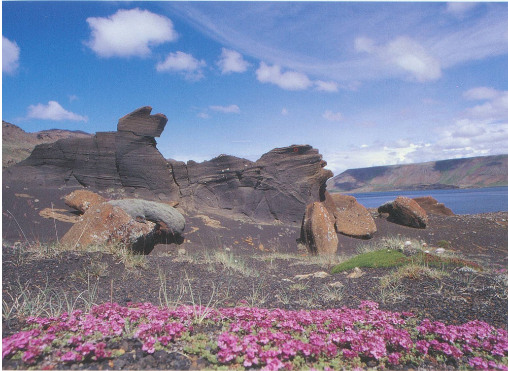
Le contraste est extrême entre les roches volcaniques et la flore islandaise.

amoureux des grands espaces, qui traversent l'île en une semaine, campant dans des conditions extrêmes.