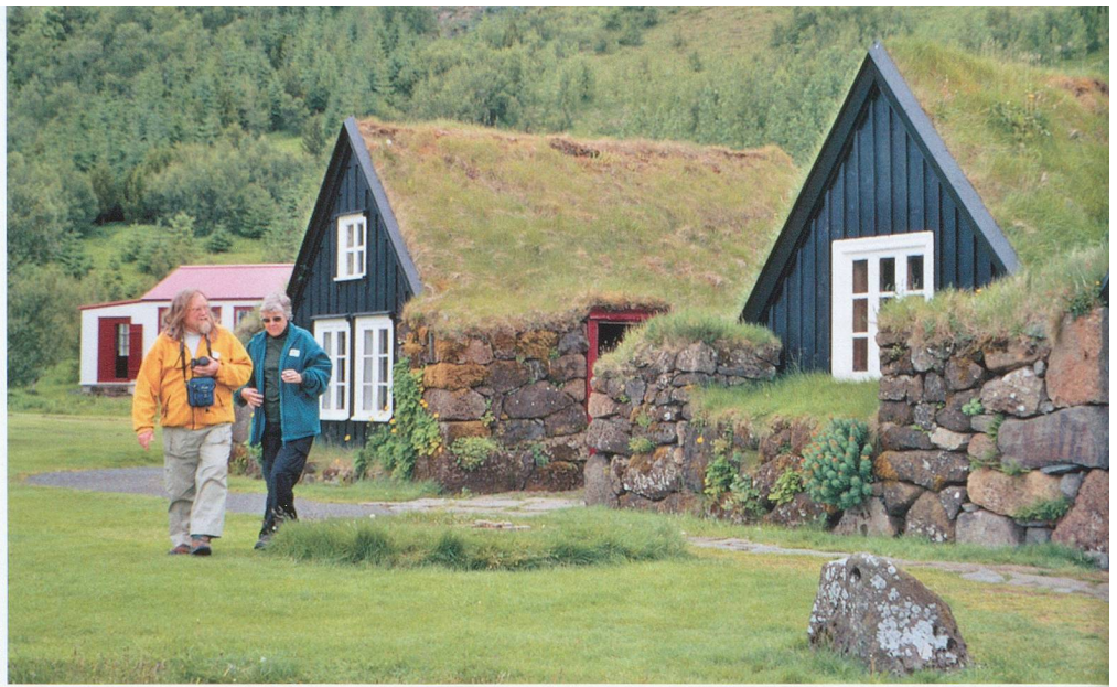
Skogar, un village-musée historique et préservé.

Dans les terrains sablonneux du sud de l'île, d'immenses champs de lupins font des taches de couleur bleue. On les a importés pour enrichir le sol. Un laboratoire utilise le fleur en infusion pour lutter contre les effets secondaires des chimiothérapies. Des