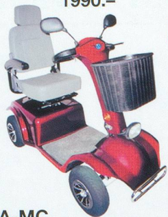
W-A-MC Voiturette électrique