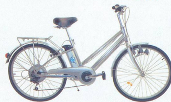
Watt-A-Bike La p'tite reine électrique