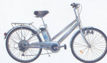
Watt-A-Bike La p'tite reine électrique