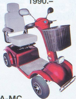
W-A-MC Voiturette électrique