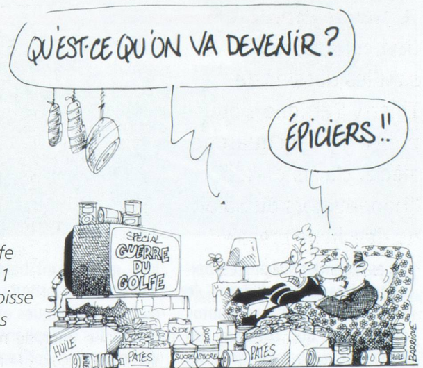
Guerre du Golfe en 1991 et angoisse dans les foyers suisses