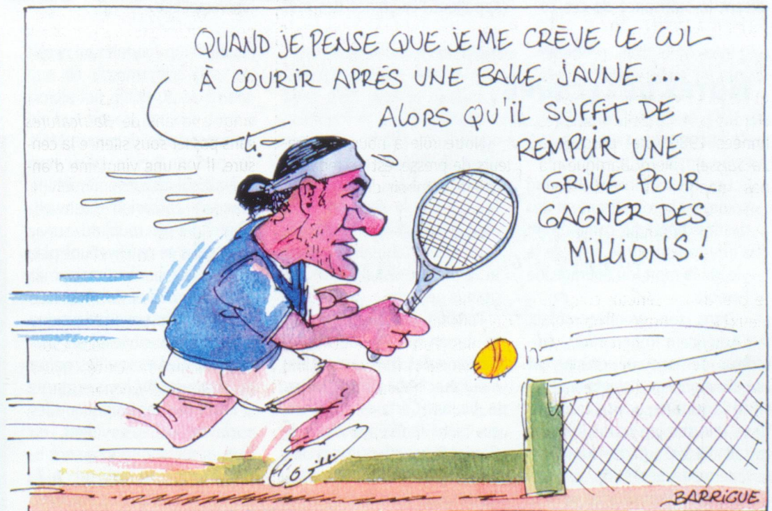
Mai 04: Roger Federer dispute Roland-Garros et la Loterie à numéros se monte à 5,7 millions de francs.

Rens. tél. 021 804 15 65 et www.morges-sous-rire.ch