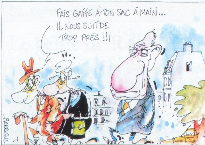
En septembre 2003, Pascal Couchepin explique son plan de financement de l'AVS.