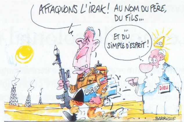
Après son père, George W. Bush part en croisade du côté de l'Irak en mars 2003.