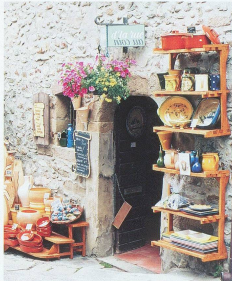
Tout le charme du Sud à Yvoire.

La petite cité médiévale d'Yvoire, fête cette année son 700 e anniversaire. Tout l'été sera animé de manifestations. Mais ce que l'on vient surtout chercher, c'est le charme des