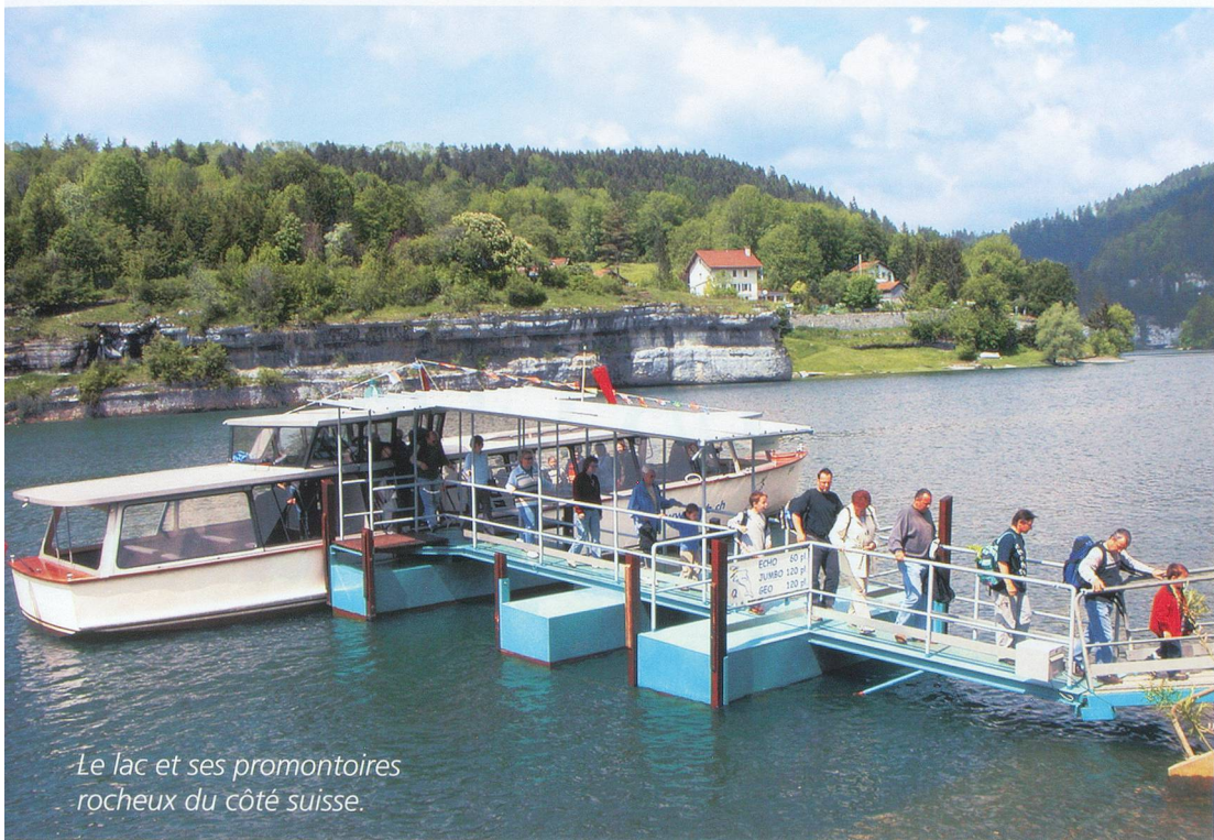
Le lac et ses promontoires rocheux du côté suisse.