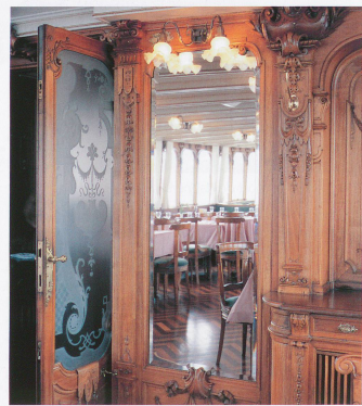
Charme et confort à bord de l'Unterwalden.

Grütli, Arnold de Melchtal, Werner Stauffacher et Walter Fürst prêtèrent serment, en 1291, de rendre leur liberté aux trois vallées. C'est aussi sur le lac et son pourtour que notre héros national Guillaume Tell s'illustra. Ces hauts faits se déroulent entre Brügglen, où il est né, le lieu-dit Tellschapel (Chapelle de Tell), près de Sissikon, où il échappa au terrible