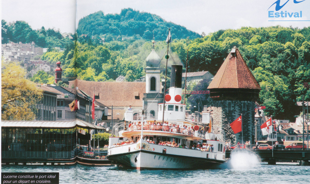
Lucerne constitue le port idéal pour un départ en croisière.

En abordant les rives verdoyantes du lac des Quatre-Cantons, on aurait tort d'imaginer pénétrer dans une réserve d'Indiens. Cette Suisse primitive n'a rien d'un musée figé à tout jamais sur des valeurs helvétiques d'un autre âge. Même si, ici, flottent sans doute davan-