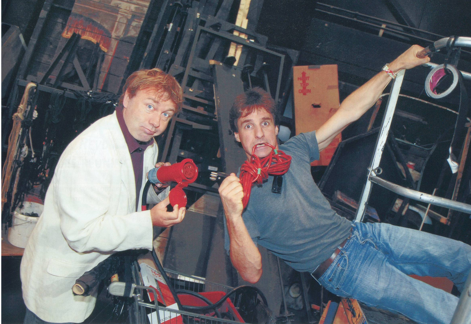
Cela fait vingt ans que les humoristes neuchâtelois amusent la Romandie. Et ce n'est pas près de s'arrêter!