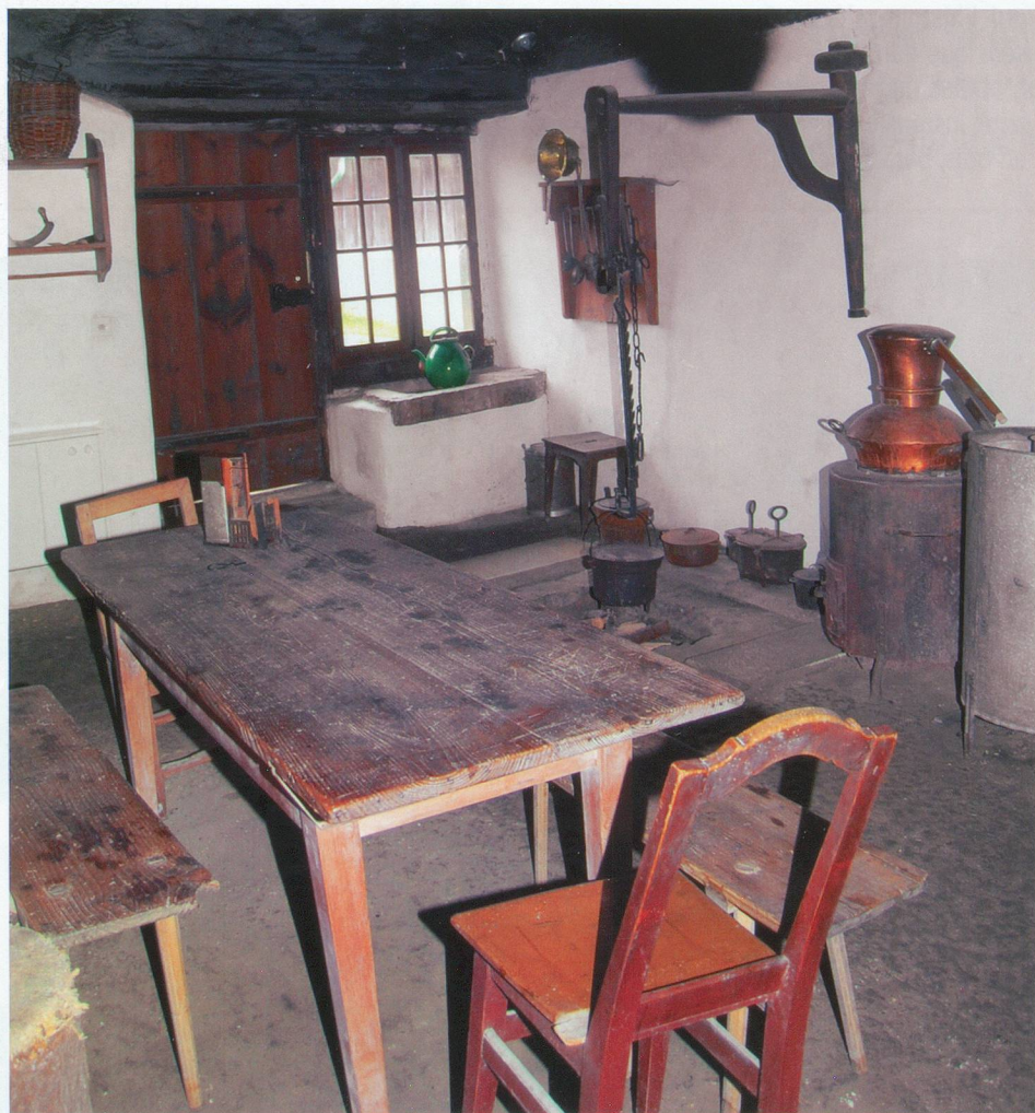
La cuisine avec âtre au sol et plafond fumé...