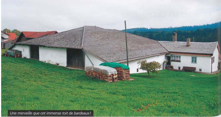
Une merveille que cet immense toit de bardeaux!