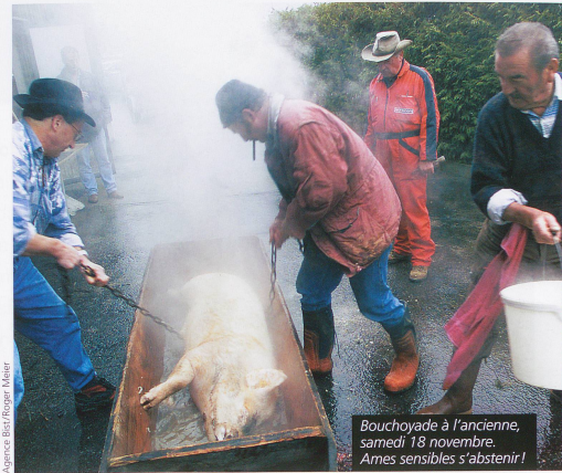
Bouchoyade à l'ancienne, samedi 18 novembre. Ames sensibles s'abstenir!