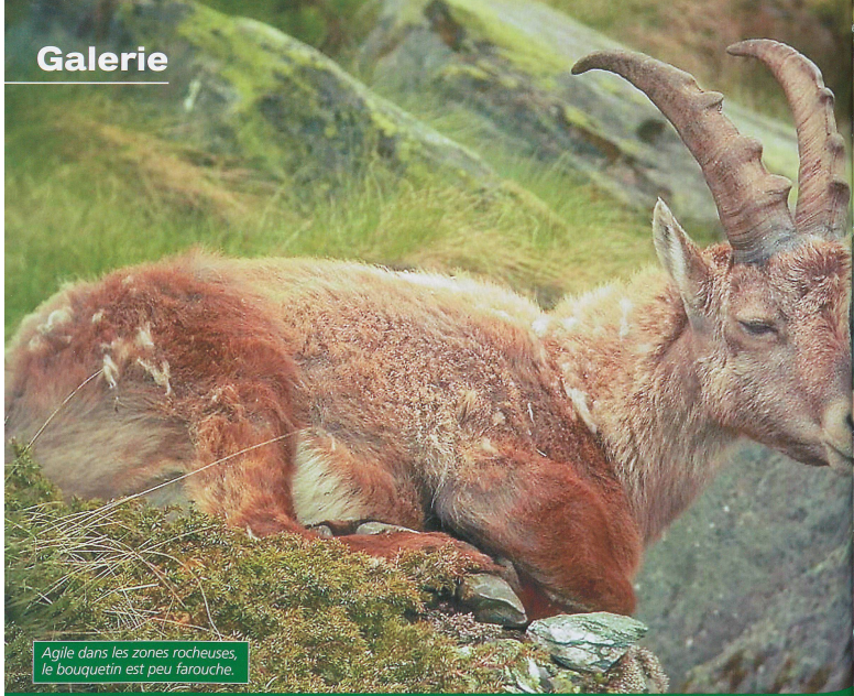
Agile dans les zones rocheuses, le bouquetin est peu farouche.