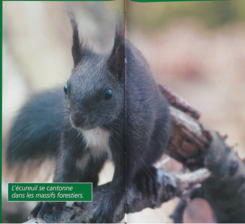
L'écureuil se cantonne dans les massifs forestiers.