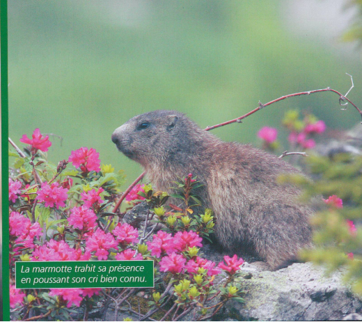
La marmotte trahit sa présence en poussant son cri bien connu.