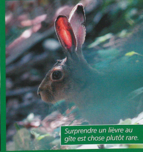
Surprendre un lièvre au gîte est chose plutôt rare.