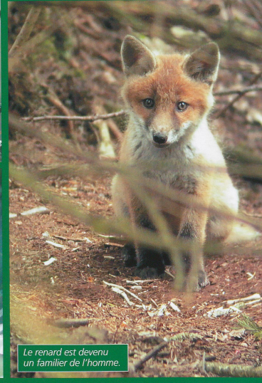
Le renard est devenu un familier de l'homme.

Formis le coup de chance, l'observation d'un mammifère passe d'abord par la connaissance du milieu qu'il affectionne. Il faut ensuite découvrir ses rythmes et ses moeurs. Si, par exemple, marmotte et écureuil sont diurnes, les chamois et les renards sont plutôt crépusculaires. D'autres encore sont franchement nocturnes. Il faut donc tenir compte des horloges biologiques de chacun pour orienter une recherche.