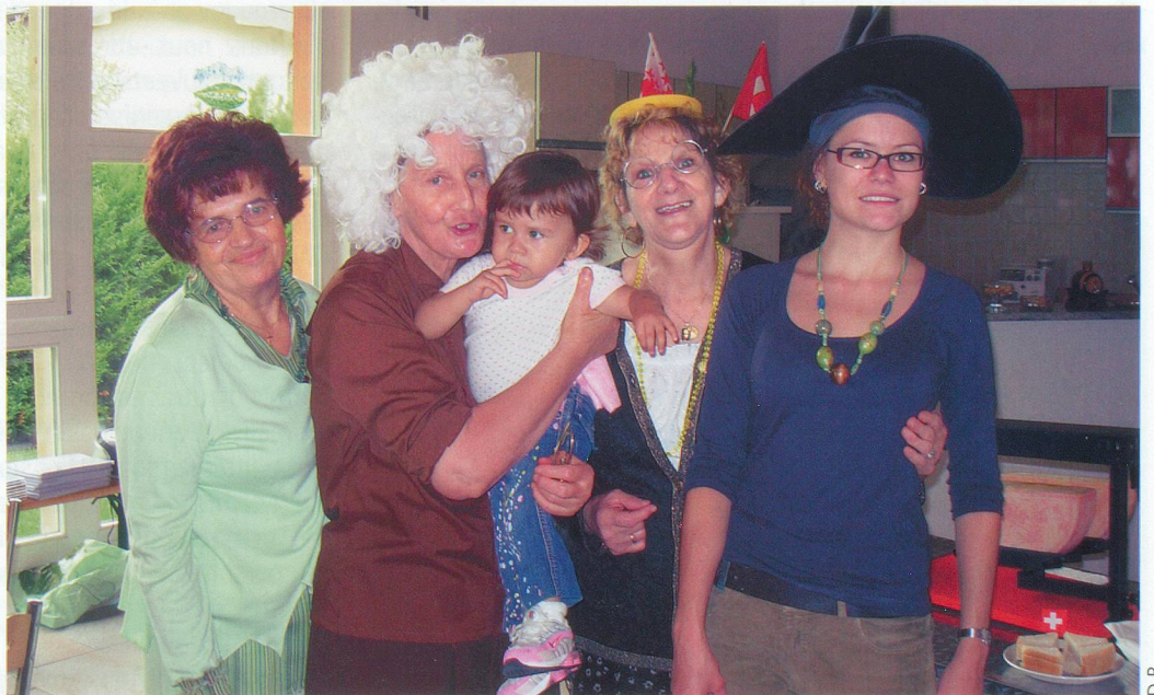
Une journée d'animation au foyer de Dorénaz par des bénévoles de Génération.

» Génération: permanence du lundi au vendredi de 8 h à 12 h, tél. 079 296 26 00; internet: www.generation.ch Pour soutenir Génération, des dons peuvent être versés sur le CCP 17-543787-2.