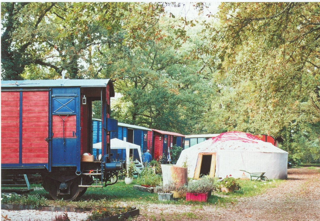
Le Hameau des chemineaux compte cinq wagons et une yourte mongole.

»» Le Hameau des chemineaux, route de Loëx, Bernex. Internet: www.carrefour-rue.ch