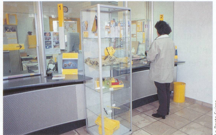
La Poste Suisse

Pour Laurent Widmer, porte-parole de La Poste, «le fait de supprimer les paiements en argent liquide permet d'assurer une meilleure sécurité des personnes âgées». Plus de billets de banque, plus de vol possible. Comment effectuer ses paiements? Il existe plusieurs possibilités, notamment par le biais