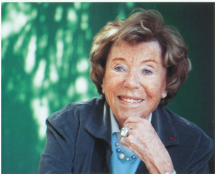
Benoîte Groult se penche avec humour et réalisme sur la vieillesse.

C'est toujours avec la même fraîcheur que Benoîte Groult tisse sous forme de roman le tableau de vies qui ressemblent aux nôtres. Son combat pour les femmes ne connaît pas de fin... et elle en mène pourtant un autre, au nom des seniors que notre société veut mettre au rancart.