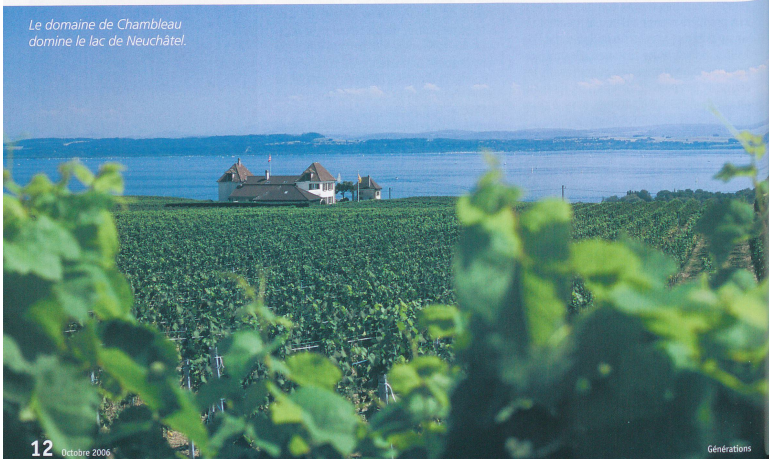
Le domaine de Chambleau domine le lac de Neuchâtel.

»»» Domaine de Chambleau, 2013 Colombier. Tél. 032 731 16 66. Internet: www.chambleau.ch Caves ouvertes les vendredis de 17 h 30 à 19 h 30 et les samedis, de 9 h à 13 h. Egalement sur rendez-vous.