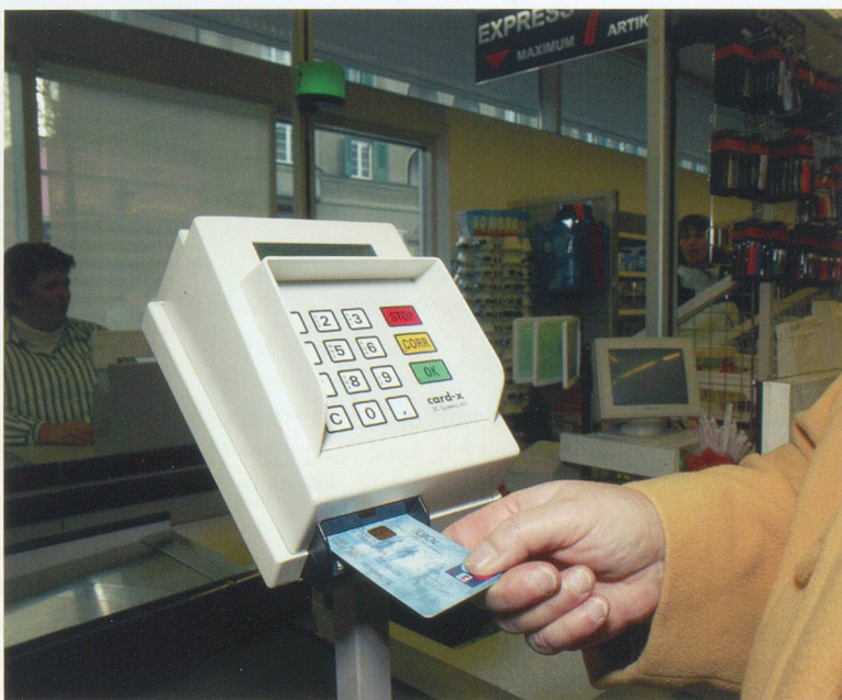
Prévention suisse de la criminalité / Neuchâtel

Conseils: il est recommandé d'utiliser les cartes bancaires, les cartes clients et les cartes de crédit. Mais n'inscrivez jamais votre code NIP sur la carte et ne le communiquez à personne, sous quelque prétexte que ce soit. Si vous ne savez pas utiliser une carte de crédit, faites-vous expliquer son fonctionnement par un spécialiste.