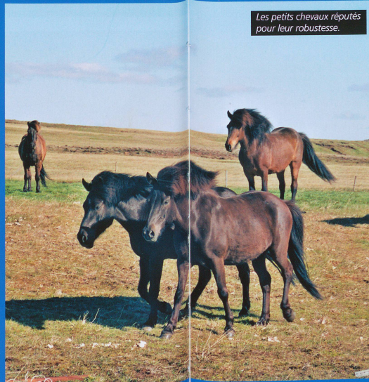
Les petits chevaux réputés pour leur robustesse.